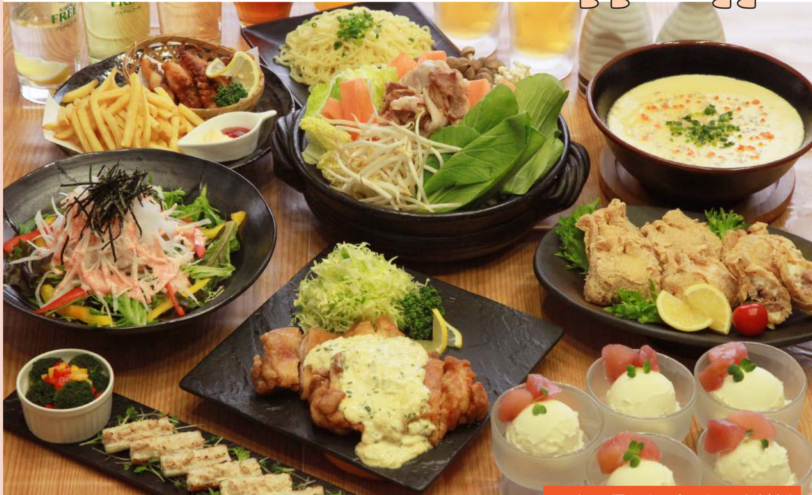
写真：雪ほりパック5人前例